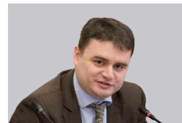
Василий Осымаков, Заместитель министра промышленности и торговли Российской Федерации

«Выставка SAPE – та площадка, где представлены прогрессивные решения и инновационные технологии по обеспечению безопасных условий в сфере охраны труда. Лучшие технологии и разработки в области СИЗ, успешные проекты и практики, показательные учения, мнения экспертов и рекомендации потребителей – все это мощные стимулы для дальнейшего гарантирования безопасности на рабочих местах».